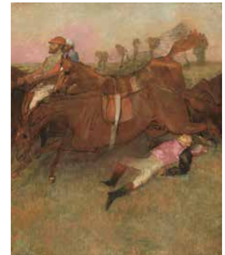
Edgar Degas, Scene from the Steeplechase: The Fallen Jockey , 1866, reworked 1880 – 1881 and c. 1897, oil on canvas, National Gallery of Art, Washington, Collection of Mr. and Mrs. Paul Mellon

43 Société des artistes français, Explication des ouvrages de peinture, sculpture, architecture, gravure et lithographie des artistes vivants , Paris, 1883, Gift of Paul Mellon, 6 3/4 × 4 1/8 in., 477 pages plus 130 pages of supplementary material, 4,943 entries