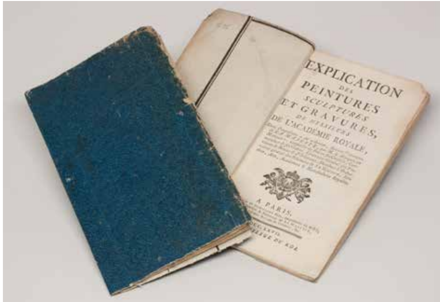
Wrappers and title page from Explication des peintures, sculptures, et gravures, de messieurs de l'Académie royale , Paris, 1767, David K. E. Bruce Fund

Marking the publication of Documenting the Salon: Paris Salon Catalogs, 1673-1945 , we present here over sixty examples of literature related to the Paris Salon drawn from nearly 250 years of exhibitions, controversies, and political upheavals. Our installation not only includes publications that trace the rise and fall of the Paris Salon — an institution in the French art world — but also links them to works in the collection of the National Gallery of Art.